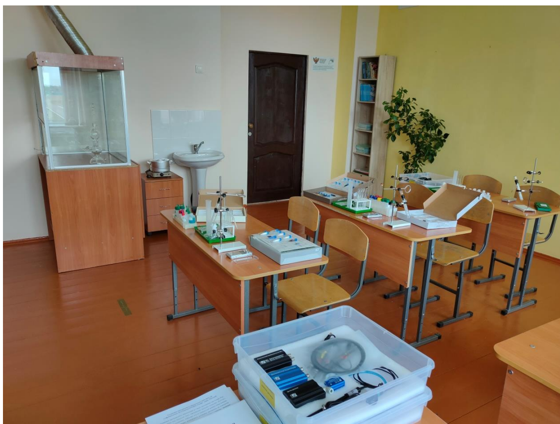
Фото 1. Кабинет химии, 2021 г.

Огромным преимуществом работы центра стало то, что дети получили возможность изучать предметы «Химия», «Физика» и «Биология» на новом учебном оборудовании.