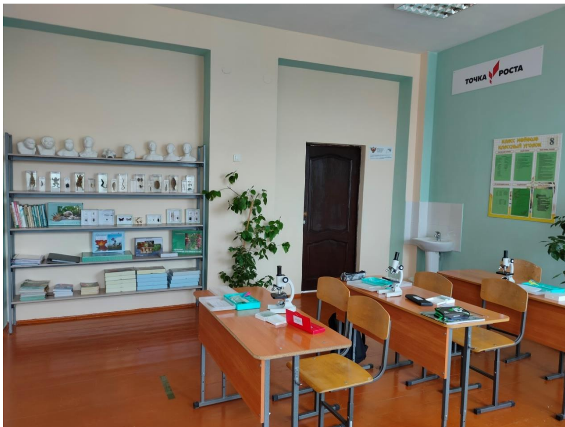
Фото 2. Кабинет биологии, 2021 г.